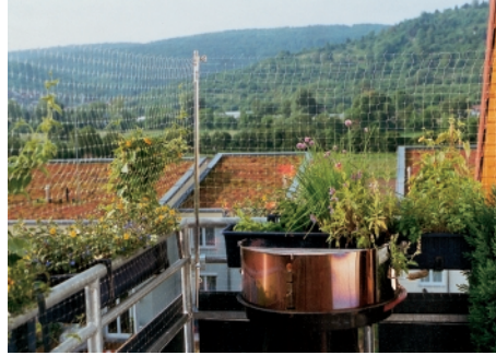
Egal ob klassischer Balkon oder Dachauschnitt, Original Kramer's Katzenschutzsysteme sind für jede Balkonform geeignet